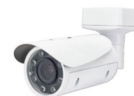
Telecamera con analisi video