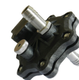
Nuovo sensore GPS in polimeri di fibra di carbonio